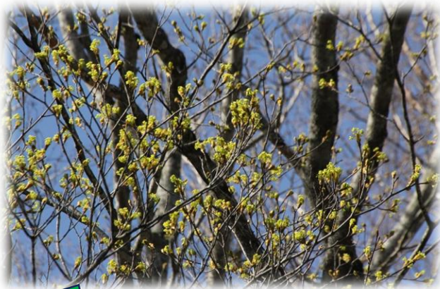
イタヤカエデ (ムクロジ科)

ビジターセンター前の石垣を見上げると、黄色い花をつけた大きな木が目にとまります。イタヤカエデです。森の中でも見ることができますので楽しみながら探してみてください。