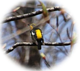
キビタキ (ヒタキ科)